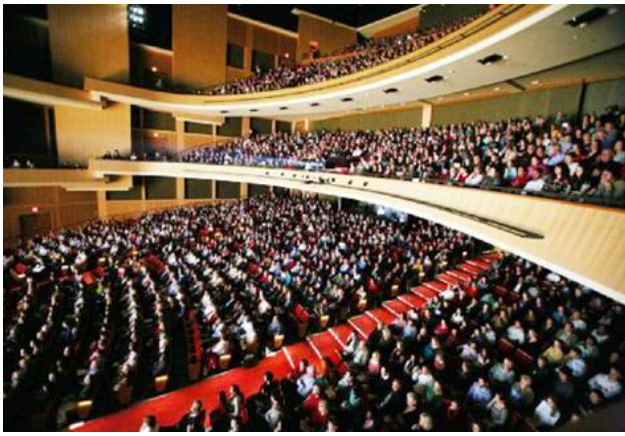
神韵艺术团在美国达姆勒市表演艺术中心上演时，2800 座位座无虚席。