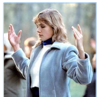
俄罗斯法轮功学员炼功

● 法轮功教人向善 法轮功是佛家修炼大法，以真、善、忍为修炼原则。修炼人从做好人做起，努力按照真、善、忍标准提升个人心性，返本归真；还包含五套缓慢优美的功法动作。法轮大法教人向善。修炼法轮功不但能祛病健身，使人变得诚实、善良、宽容、和平，而且能开启智慧，逐渐达到洞悉人生和宇宙奥秘的自在境界。