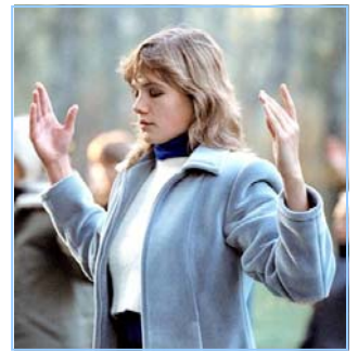
俄罗斯法轮功学员炼功

● 法轮功教人向善 法轮功是佛家修炼大法，以真、善、忍为修炼原则。修炼人从做好人做起，努力按照真、善、忍标准提升个人心性，返本归真；还包含五套缓慢优美的功法动作。法轮大法教人向善。修炼法轮功不但能祛病健身，使人变得诚实、善良、宽容、和平，而且能开启智慧，逐渐达到洞悉人生和宇宙奥秘的自在境界。