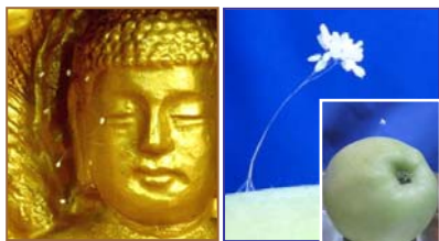
左：韩国须弥山禅院佛像上的婆罗花。右：纽约苹果上的婆罗花。

最近，传说三千年一开的优昙婆罗花再次出现在美国纽约上州。神奇小白花盛开在一个从果园摘的苹果上。