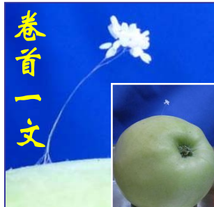
上图：纽约上州，苹果上的优昙婆罗花。

根据佛经记载，优昙婆罗是梵文的音译，意为灵瑞花、空起花、起空花。“优昙婆罗花”是传说中的仙界极品之花，因其花“青白无俗艳”被尊为佛家花。婆罗奇花花茎细如发丝、蚕丝，色如玉，白如雪，花形如钟，周围散发着淡淡的光晕，有的散发出淡淡清香。