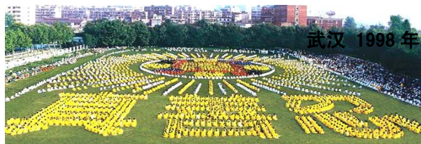
武汉 1998 年

二零零九年九月二十六日晚，亚太人权基金会“人权领袖奖”颁奖典礼在美国洛杉矶鲍温公园市隆重举行，当主持人宣布今年的特殊奖项“杰出精神领袖奖”由法轮功创始人李洪志先生获得时，全场长时间热烈鼓掌。洛杉矶法轮功学