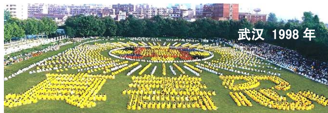
武汉 1998 年