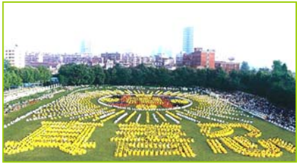
1997年武汉五千多法轮功学员炼功, 排组法轮图形和“真善忍”字样

1999年7月20日,中共发动了对法轮功的全面迫害,引发全球法轮功学员反迫害、讲真相活动。◇