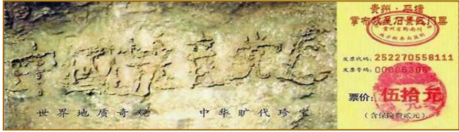
贵州省平塘县风景区内的“藏字石”，距今 2.7 亿年，石头断面上天然形成六个大字：中国共产党亡。