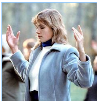
俄罗斯法轮功学员炼功

● 法轮功教人向善 法轮功是佛家修炼大法，以真、善、忍为修炼原则。修炼人从做好人做起，努力按照真、善、忍标准提升个人心性，返本归真；还包含五套缓慢优美的功法动作。法轮大法教人向善。修炼法轮功不但能祛病健身，使人变得诚实、善良、宽容、和平，而且能开启智慧，逐渐达到洞悉人生和宇宙奥秘的自在境界。