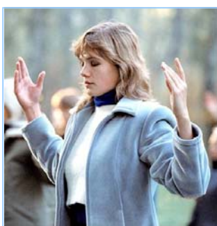
俄罗斯法轮功学员炼功

● 法轮功教人向善 法轮功是佛家修炼大法，以真、善、忍为修炼原则。修炼人从做好人做起，努力按照真、善、忍标准提升个人心性，返本归真；还包含五套缓慢优美的功法动作。法轮大法教人向善。修炼法轮功不但能祛病健身，使人变得诚实、善良、宽容、和平，而且能开启智慧，逐渐达到洞悉人生和宇宙奥秘的自在境界。