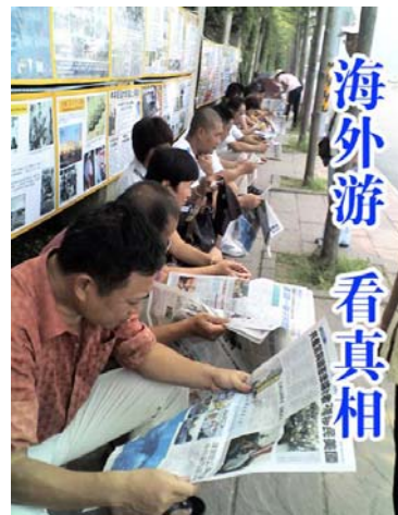
■在台湾景点高雄西子湾的真相看板前，成列的大陆游客专注地翻阅真相资料。

在台湾各大景点也都能看到法轮功真相展板和退党服务点。很多大陆游客与真相展板合影留念，并声明三退，有时甚至整团整团地退。在香港及世界各地的景点也发生着同样的故事。◇