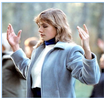
俄罗斯法轮功学员炼功

● 法轮功教人向善 法轮功是佛家修炼大法，以真、善、忍为修炼原则。修炼人从做好人做起，努力按照真、善、忍标准提升个人心性，返本归真；还包含五套缓慢优美的功法动作。法轮大法教人向善。修炼法轮功不但能祛病健身，使人变得诚实、善良、宽容、和平，而且能开启智慧，逐渐达到洞悉人生和宇宙奥秘的自在境界。