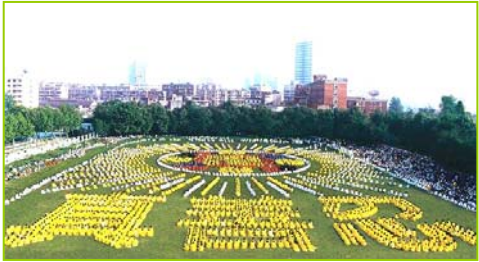
1997年武汉五千多法轮功学员炼功，排列法轮图形和“真善忍”字样

背景资料: 法轮大法是由李洪志先生于1992年5月传出的佛家上乘修炼大法，以“真善忍”为根本指导，按照宇宙演化原