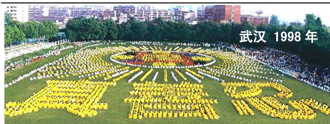
武汉 1998 年