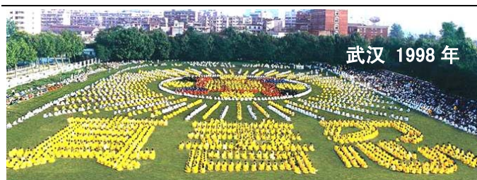
武汉 1998 年