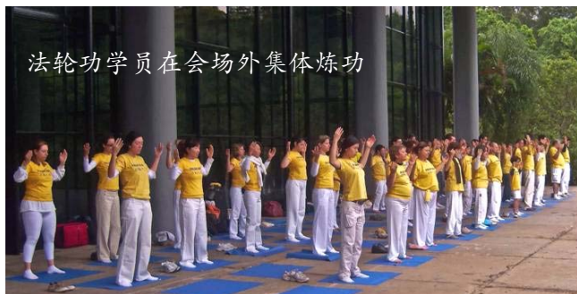
法轮功学员在会场外集体炼功

二零零九年十月十一日，巴西法轮功学员在圣保罗成功的举行了第一次全国法会。来自巴西全国各地，包括圣保罗、里约热内卢、巴西利亚、南大河州等的部分学员首次聚集在圣保罗，交流修炼体会并互相鼓励，共同提高。