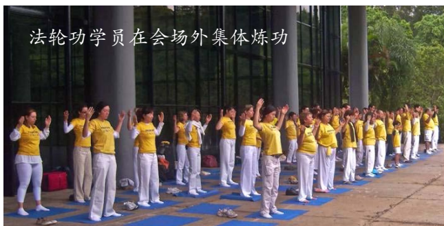
法轮功学员在会场外集体炼功

二零零九年十月十一日，巴非法轮功学员在圣保罗成功的举行了第一次全国法会。来自巴西全国各地，包括圣保罗、里约热内卢、巴西利亚、南大河州等的部分学员首次聚集在圣保罗，交流修炼体会并互相鼓励，共同提高。