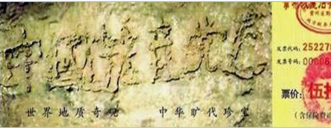
■ 2002 年在贵州平塘县掌布乡发现的藏字石，石头断面上天然形成六个字：中国共产党亡，昭示着“天灭中共”的天意。图为风景区门票。

大伙呼拉一下过来围著名单，争着挑选自己中意的名儿。连阴先生也要了个名儿。一年轻人悄声对王老太太说：“那个叫‘神了，神了’的人，就是我们那的公安厅长。”