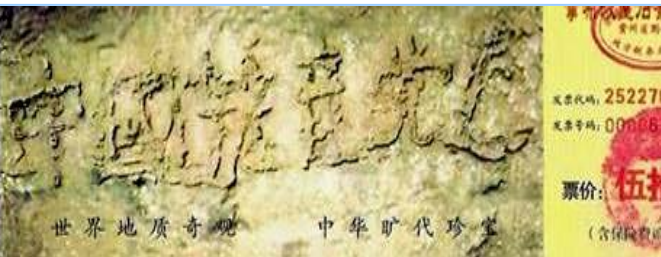
■ 2002 年在贵州平塘县掌布乡发现的藏字石，石头断面上天然形成六个字：中国共产党亡，昭示着“天灭中共”的天意。图为风景区门票。

大伙呼拉一下过来围著名单，争着挑选自己中意的名儿。连阴先生也要了个名儿。一年轻人悄声对王老太太说：“那个叫‘神了，神了’的人，就是我们那的公安厅长。”