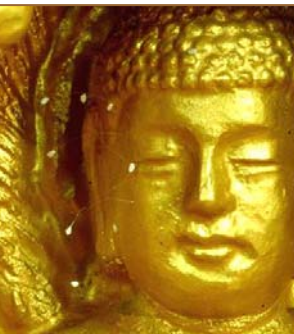
上图：纽约上州，苹果上的优昙婆罗花。