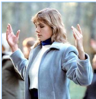
俄罗斯法轮功学员炼功

● 法轮功教人向善 法轮功是佛家修炼大法，以真、善、忍为修炼原则。修炼人从做好人做起，努力按照真、善、忍标准提升个人心性，返本归真；还包含五套缓慢优美的功法动作。法轮大法教人向善。修炼法轮功不但能祛病健身，使人变得诚实、善良、宽容、和平，而且能开启智慧，逐渐达到洞悉人生和宇宙奥秘的自在境界。