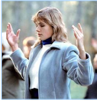
俄罗斯法轮功学员炼功

● 法轮功教人向善 法轮功是佛家修炼大法，以真、善、忍为修炼原则。修炼人从做好人做起，努力按照真、善、忍标准提升个人心性，返本归真；还包含五套缓慢优美的功法动作。法轮大法教人向善。修炼法轮功不但能祛病健身，使人变得诚实、善良、宽容、和平，而且能开启智慧，逐渐达到洞悉人生和宇宙奥秘的自在境界。