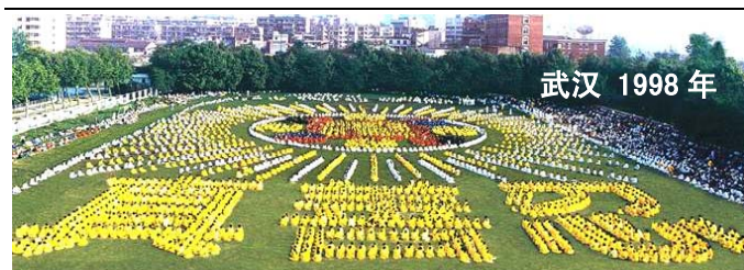
武汉 1998 年