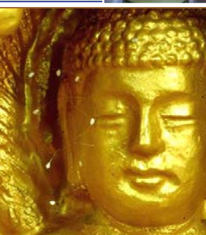
上图：纽约上州，苹果上的优昙婆罗花。