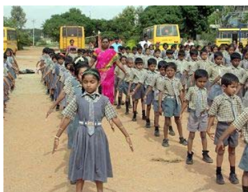
印度班加罗尔 Byreshawara 学校学生集体炼法轮功