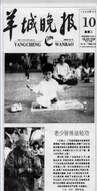
《羊城晚报》1998 年 11 月 10 日头版报道：“老少皆炼法轮功”