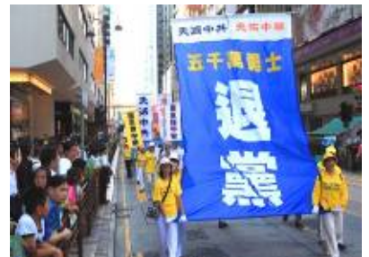
香港的退党大游行

辽宁省某戒毒所所长，前段时间到香港考察，看到了一个令他震惊的事实：在香港，法轮功学员传《九评共产党》、发法轮功真相传单、劝市民三退（退党团队）、炼功、游行等等，一切活动都是公开的、受当地法律保护的。这位所长回来后讲