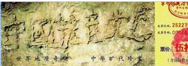
■2002 年在贵州平塘县掌布乡发现的藏字石，石头断面上天然形成六个字：中国共产党亡，昭示着“天灭中共”的天意。图为风景区门票。

大伙呼拉一下过来围著名单，争著挑选自己中意的名儿。连阴先生也要了个名儿。一年轻人悄声对王老太太说：“那个叫‘神了，神了’的人，就是我们那的公安厅长。”