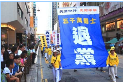
奇书《九评共产党》，深刻揭露了中共邪恶本质和红朝谎言，引发了一场中华民族觉醒自救运动。到 2009 年 10 月 5 日已有 6145 万中国民众在海外大纪元网站声明三退。

大伙呼拉一下过来围著名单，争著挑选自己中意的名儿。连阴先生也要了个名儿。一年轻人悄声对王老太太说：“那个叫‘神了，神了’的人，就是我们那的公安厅长。”