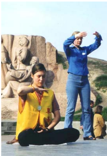
两位乌克兰女士在炼法轮