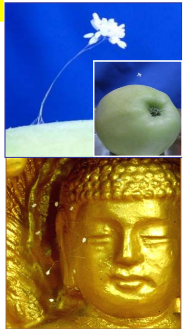
上图：美国纽约，苹果上的优昙婆罗花。下图：韩国须弥山禅院佛像上的婆罗花。