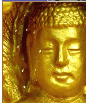
上图：美国纽约，苹果上的优昙婆罗花。