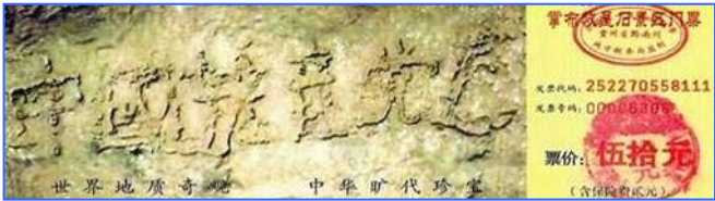
■贵州平塘县掌布风景区的“藏字石”，被中科院地质专家鉴定为五百年前从崖壁落下一分为二，石头断面上天然形成六个字—— 中国共产党亡 ，昭示着天灭中共的天象。

父亲知道后有些意外，没想到老上司这么容易就退了。看来中共内部的很多高层干部，都明白中共长不了，都人心思退党呢。◇