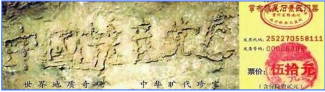
■贵州平塘县掌布风景区的“藏字石”，被中科院地质专家鉴定为五百年前从崖壁落下一分为二，石头断面上天然形成六个字—— 中国共产党亡 ，昭示着天灭中共的天象。

父亲知道后有些意外，没想到老上司这么容易就退了。看来中共内部的很多高层干部，都明白中共长不了了，都人心思退党呢。◇