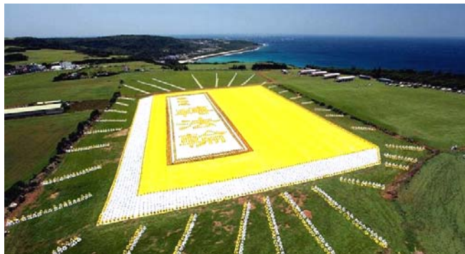
■ 2009 年 5 月 9 日，6000 多名台湾法轮功学员集体炼功，排演《转法轮》一书，贺大法传世十七周年。

● 弘传世界 各国褒奖 法轮功已弘传世界 114 个国家和地区，受到世界人民的爱戴和尊敬，获得各国政府褒奖、支持议案信函 3000 多项。法轮功书籍被译成 30 多种语言，在全世界出版发行，并可从网上免费下载。