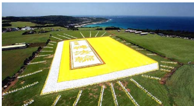
■ 2009 年 5 月 9 日，6000 多名台湾法轮功学员集体炼功，排演《转法轮》一书，贺大法传世十七周年。

● 弘传世界 各国褒奖 法轮功已弘传世界 114 个国家和地区，受到世界人民的爱戴和尊敬，获得各国政府褒奖、支持议案信函 3000 多项。法轮功书籍被译成 30 多种语言，在全世界出版发行，并可从网上免费下载。