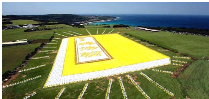
2009 年 5 月 9 日，6000 多名台湾法轮功学员集体炼功，排演《转法轮》一书，贺大法传世十七周年。

● 弘传世界 各国褒奖 法轮功已弘传世界 114 个国家和地区，受到世界人民的爱戴和尊敬，获得各国政府褒奖、支持议案信函 3000 多项。法轮功书籍被译成 30 多种语言，在全世界出版发行，并可从网上免费下载。