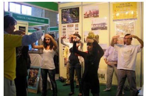
■ 参观者当场学炼法轮功功法

参展的另一展位的女士听了法轮大法介绍会。第二天，她到法轮大法展位前高兴地对学员说：“法轮大法非常好！”她告诉学员：“展会开始前一天，我的胳膊突然很痛，痛得抬不起来，我很着急，不知如何度过这四天的展会工作。没想到昨天参加介绍会，又学了第一套功法后，我发现原本痛得很厉害的胳膊竟神奇地好了！”