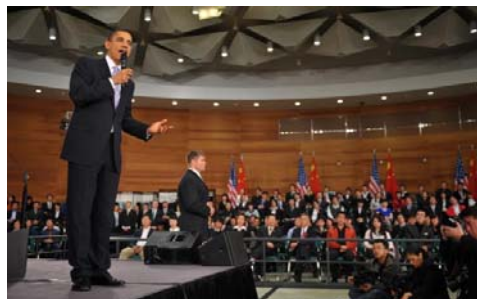
■奥巴马 16 日在上海一个美国式的镇民大会中与被安排的“学生”对话

美联社说：美国总统奥巴马在中国就言论自由和网络审查“将”了中共一军，可惜大多数中国民众看不到，因为他的话在网络上遭到封锁，而且只有一个地方电视转播。