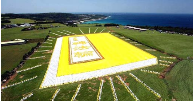
2009年5月9日，6000多名台湾法轮功学员集体炼功，排演《转法轮》一书，贺大法传世十七周年。

● 弘传世界 各国褒奖 法轮功已弘传世界114个国家和地区，受到世界人民的爱戴和尊敬，获得各国政府褒奖、支持议案信函3000多项。法轮功书籍被译成30多种语言，在全世界出版发行，并可从网上免费下载。