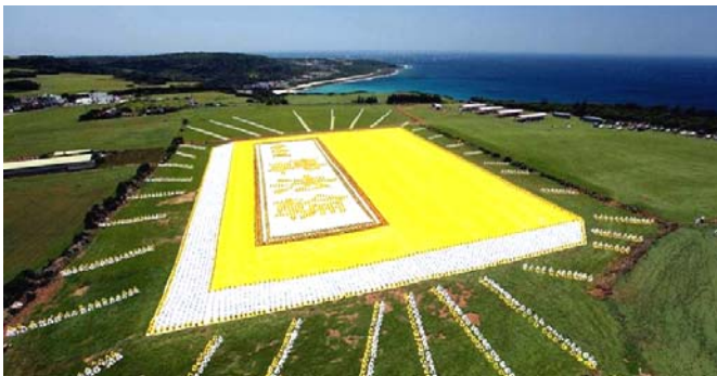
2009年5月9日，6000多名台湾法轮功学员集体炼功，排演《转法轮》一书，贺大法传世十七周年。

● 弘传世界 各国褒奖 法轮功已弘传世界114个国家和地区，受到世界人民的爱戴和尊敬，获得各国政府褒奖、支持议案信函3000多项。法轮功书籍被译成30多种语言，在全世界出版发行，并可从网上免费下载。