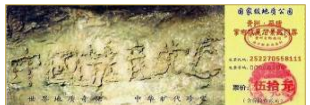
■贵州省平塘县掌布风景区内的“藏字石”，石头断面上天然形成六个字：“中国共产党亡”。图为风景区门票。

中国不等于中共，爱国不等于爱党。中共为了维护它的独裁政权，强行把“爱党就是爱国”、“亡党亡国”灌输给老百姓，企图把邪党与中国绑在一起。中国五千年文明历史，而西来幽灵中共才几十年，怎么能说它是中国呢？中国先后经历了二十多个朝代，从兴起到灭亡，中国也没有随着哪个朝代的灭亡而灭亡。哪一朝去了下一朝不来？中共邪党灭亡了，中国依然会屹立在世界的东方。没有了中共邪党，勤劳智慧的中国人民一定会复兴中华文明历史的灿烂辉煌，那是全世界人民都仰慕的璀璨文明。所以，退党才是真爱国：要做中华儿女，不做马列子孙！