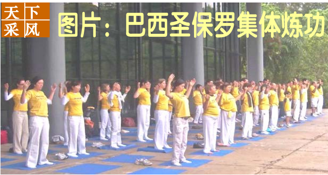
二零零九年十月十一日，南美洲巴西法轮功学员在圣保罗成功的举行了第一次全国法会，包括圣保罗、里约热内卢、巴西利亚、南大河州等地部分学员首次聚集在圣保罗，交流修炼体会并在会场外集体炼功。