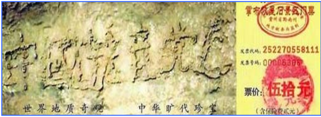
■贵州平塘县掌布风景区的“藏字石”，被中科院地质专家鉴定为五百年前从崖壁落下一分为二，石头断面上天然形成六个字—— 中国共产党亡 ，昭示着天灭中共的天象。

父亲知道后有些意外，没想到老上司这么容易就退了。看来中共内部的很多高层干部，都明白中共长不了了，都人心思退党呢。