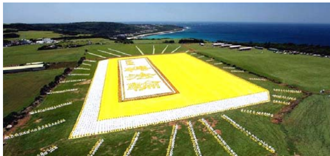
2009年5月9日，6000多名台湾法轮功学员集体炼功，排演《转法轮》一书，贺大法传世十七周年。

● 弘传世界 各国褒奖 法轮功已弘传世界114个国家和地区，受到世界人民的爱戴和尊敬，获得各国政府褒奖、支持议案信函3000多项。法轮功书籍被译成30多种语言，在全世界出版发行，并可从网上免费下载。