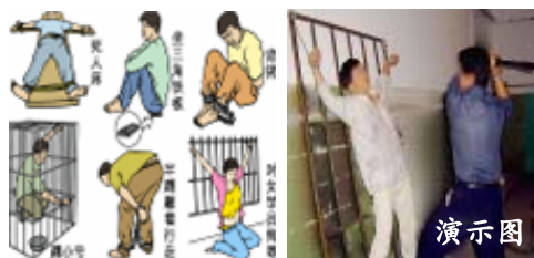
中共迫害法轮功学员酷刑图示

到目前从中共邪党对法轮功的残酷的邪恶迫害中，延边地区已有30多位法轮功学员离世。原本很多幸福的家庭因此而妻离子散家破人亡。但是中共邪党还要把这个乱世粉饰为太平盛世，又撒着弥天大谎，称现在是中国的人权状况最好时期。中国不等于中共、爱国不等于爱党，希望中国人民能分清这最基本的概念，认清中共邪党远离这个人类历史上最邪恶的恶魔，选择美好的未来。