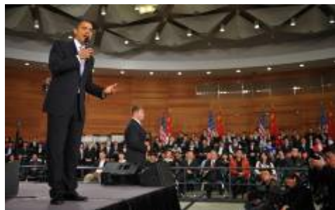
■奥巴马 16 日在上海一个美国式的镇民大会中与被安排的“学生”对话

美联社说：美国总统奥巴马在中国就言论自由和网络审查“将”了中共一军，可惜大多数中国民众看不到，因为他的话在网络上遭到封锁，而且只有一个地方电视转播。