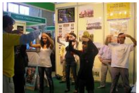
■ 参观者当场学炼法轮功功法

参展的另一展位的女士听了法轮大法介绍会。第二天，她到法轮大法展位前高兴地对学员说：“法轮大法非常好！”她告诉学员：“展会开始前一天，我的胳膊突然很痛，痛得抬不起来，我很着急，不知如何度过这四天的展会工作。没想到昨天参加介绍会，又学了第一套功法后，我发现原本痛得很厉害的胳膊竟神奇地好了！”