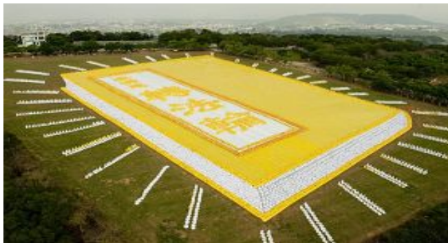
■ 2009年11月21日，6000多名台湾法轮功学员集体炼功，排演《转法轮》一书，贺大法传世十七周年。

后来，这位大妈去世了，一天后她又活了过来，她说：“我确实到了阎王那里，阎王说：你是看了宝书的人，我们这里不敢收你，你还是回去吧。我就回来了。”她的家人都很惊喜，又很好奇，因她从来不读书，便问她看了什么宝书？