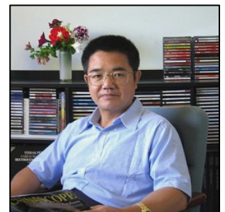
中国著名人权律师郭国汀

首位在中国境内为法轮功学员辩护、现定居在加拿大西部的中国著名人权律师郭国汀认为，西班牙国家法庭正式以刑事诉讼形式，以“群体灭绝罪”及“酷刑罪”起诉五名首恶，目前可以说是第一例，有划时代意义，很可能在世界范围里起到示范、带头作用，今后各国国家都可能用这个罪名起诉他。郭国