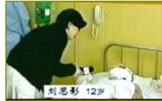
■ 气管切开还能说唱？无