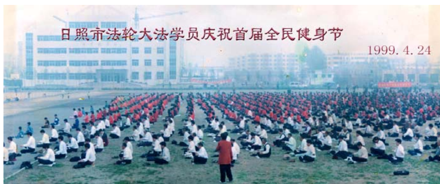
历史照片：山东省日照市法轮大法弟子集体炼功

【明慧网二零零九年十一月二十四日】一九九九年四月二十四日，山东省日照市法轮大法弟子集体炼功。