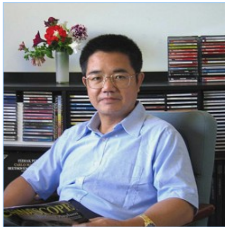
中国著名人权律师郭国汀

郭国汀说，审判对中共当权者会起到很大的威慑作用。法院既然已经受理，说明法院已经进行过基本调查，取得初步证据，经过法庭审讯、法庭辩护后，就会变成终结证据，也就是定案证据，法庭就会做出缺席判决，这是一个生效的判决，以后这五个人，只要走出国门，不管走到哪里都可能被逮捕。郭国汀认为，诉讼案会让中国民众知道，任何犯罪的人，不管是国家首脑、政府官员，都逃不出法律的天罗地网，逃不过正义法庭的审判。