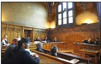
西班牙国家法院