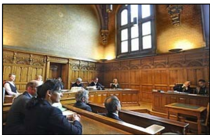
西班牙国家法院