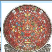
玛雅金字塔和 玛雅人的历法盘