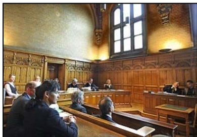
西班牙国家法院