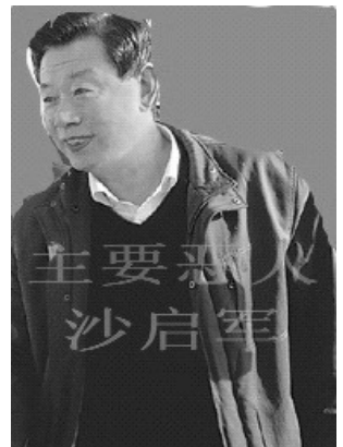
沙启军，男，现任中原油田局党委书记