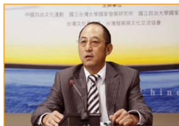
知名法学家袁红冰