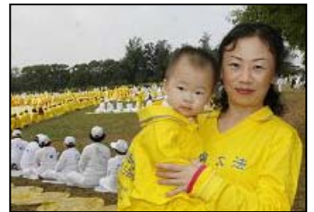
左：一家大小齐来参加组字 右：日本的许田母子