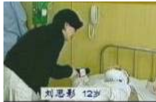
气管切开还能说唱？记者采访不穿防护服，不戴口罩。