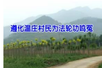
遵化温庄村民为法轮功鸣冤

“我们是河北省遵化市温庄村的十几户农民，没有炼过法轮功，但通过我们村炼功人的表现，知道他们是有道德的好人。村里有次失火，是法轮功