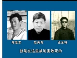
就是在这里被迫害致死的

荷花坑劳教所，位于荷花坑蔬菜批发市场的南侧，2001 年法轮功被迫害高峰时，这里曾关押法轮功学员 200 多人。