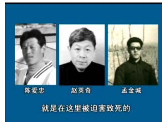
就是在这里被迫害致死的

荷花坑劳教所，位于荷花坑蔬菜批发市场的南侧，2001 年法轮功被迫害高峰时，这里曾关押法轮功学员 200 多人。