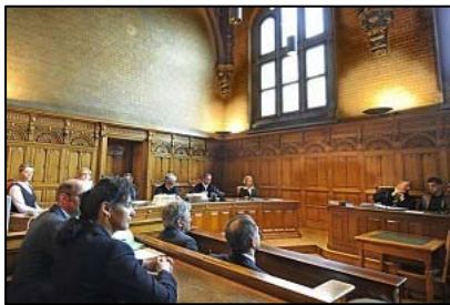
西班牙国家法院