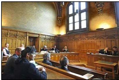
西班牙国家法院