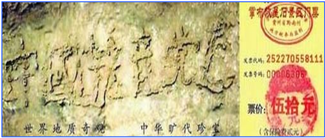
■贵州平塘县掌布风景区的“藏字石”，被中科院地质专家鉴定为五百年前从崖壁落下一分为二，石头断面上天然形成六个字—— 中国共产党亡 ，昭示着天灭中共的天象。

父亲知道后有些意外，没想到老上司这么容易就退了。看来中共内部的很多高层干部，都明白中共长不了了，都人心思退党呢。