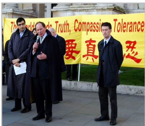
欧洲议会副主席斯考特先生在记者会上发言

【明慧网】十二月十日，国际人权日，法轮功学员在英国伦敦市中心鸽子广场的北面平台举行集会和游行活动，呼吁民众关注正在中国发生的人权迫害，包括中共活摘法轮功学员人体器官的罪恶行径，呼吁民众伸出援手共同制止中共对法轮功的迫害。欧洲议会副主席斯考特先生在发言中说，他对西班牙最高法院起诉江泽民等五人的决定非常欢迎。他想要警告在中国施行迫害或酷刑行径的那些人，在当今社会，酷刑罪是没有豁免权的。◇