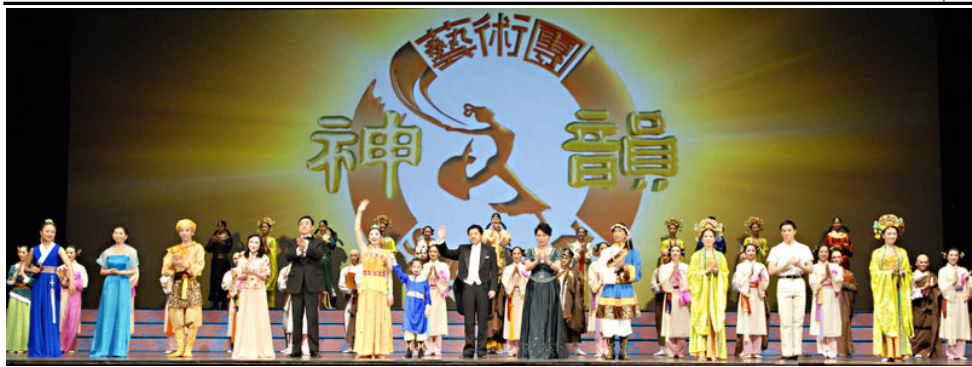
■二零零九年十二月十九日晚，神韵演员在奥古斯塔第二场演出后谢幕。