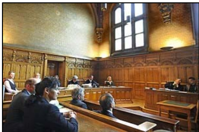
西班牙国家法院