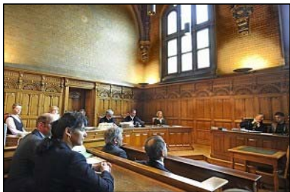
西班牙国家法院