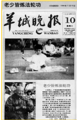
■ 1998年11月10日《羊城晚报》：老少皆炼法轮功

十年镇压,法轮大法至今却已弘传世界110多个国家和地区,获得各国政府褒奖、支持议案信函3000多项。法轮功的主要书籍《转法轮》已翻译成30多种文字,成为世界上流行最广的书籍之一,在全世界出版发行,并可从网上免费下载。