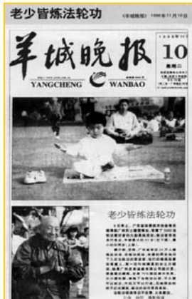
■ 1998年11月10日《羊城晚报》：老少皆炼法轮功

十年镇压,法轮大法至今却已弘传世界110多个国家和地区,获得各国政府褒奖、支持议案信函3000多项。法轮功的主要书籍《转法轮》已翻译成30多种文字,成为世界上流行最广的书籍之一,在全世界出版发行,并可从网上免费下载。